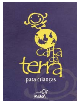
巴西儿童版《地球宪章》画册封面

由于本身从事教育工作，我须要不断地寻找合适的教学资源，来鼓励学生更加关注周遭世界，并让他们知道自己在未来所要扮演的重要角色。我发现《地球宪章》是个非常有价值的工具，它帮助我们看到自己原来属于一幅大画作中的一小部分，并且我们需要互相合作。