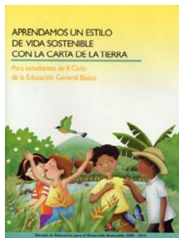
哥斯达黎加《地球宪章教师手册》封面