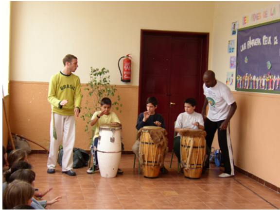
一堂跨文化交流课

每所学校都以一本儿童权利手册和《地球宪章》为基础来研发学校各自的系列活动。然后，再鼓励老师依此拓展自己的愿景。通过简明的插图来表现地球是人类的家园，这样连三岁的幼儿都能够对《地球宪章》有最初步的认识。对于年长一些的儿童，则可以建议基于《地球宪章》的诸如文化交流研讨会，或摄影比赛等活动，