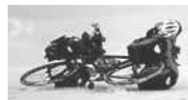
利用人力周游世界

当“探索旅行”队伍拜访一个社区时，他们传递《地球宪章》的信息，并在学校举行《地球宪章》和探索旅行中热点话题的讨论会。所有报名“探索学校课堂”（Brink School Room）的学校收到了一个学习袋（School Pack），内容包含《地球宪章》、儿童版《地球宪章》、和联合国教科文组织发行的CD—《可持续未来的教学》、以及其它由探索队提供的相关材料。“探索学校课堂”的网站目前已经有包括澳大利亚、美国、委内瑞拉、智利、阿根廷、哈萨克斯坦、西班牙和瑞典等国家的65所学校的参与。